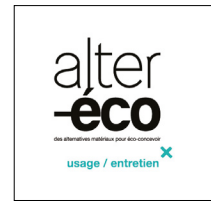
Alter éco III Usage / entretien

Sélection de quarante matériaux innovants qui sont issus de déchets de production ou de consommation ou qui sont 100% biodégradables afin de favoriser leur gestion en fin d'utilisation. Coffret disponible à 80 €.