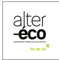
Alter éco IV Fin de vie

Sélection de cinquante-huit super-matériaux et créations à hautes performances qui sont issus d'avancées technologiques remarquables, souvent peu connus, parfois stupéfiants, magiques ou insolites.