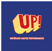
UP! Matériaux hautes performances

Sélection de quarante-quatre matériaux souples, flexibles, mous et élastiques destinés à tous secteurs d'application (bâtiment, mode, transport, ameublement, médecine, sport, loisirs, design produit ou encore ameublement).