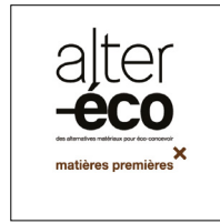
Alter éco I Matières premières

Trente solutions permettant de réduire les impacts environnementaux liés à la fabrication et au transport : nouveaux procédés pour optimiser la production (économie d'énergie et de matières), matériaux plus légers, systèmes de fixation amovible... Coffret disponible à 80 €.