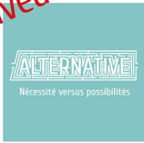
Alternative Nécessité versus possibilités

Edition 2018 140 pages Français / anglais