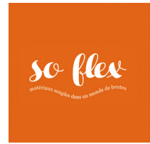
So Flex Matériaux souples dans un monde de brutes

Sélection de quarante matériaux qui ont la capacité de nous surprendre et de questionner notre intuition. Quel que soit le domaine concerné, ils ont le pouvoir de nous dérouter par leur composition ou leur rôle.