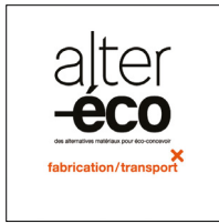
Alter éco II Fabrication / Transport

Edition 2013 127 pages Français / anglais