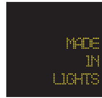
Made in lights

100% renouvelables, ces quarante matériaux fabriqués essentiellement à partir de matières végétales ou animales, ont été développés pour éco-concevoir dans divers domaines, du design à la construction, en passant par le stylisme, la décoration ou le packaging... Coffret disponible à 80 €.